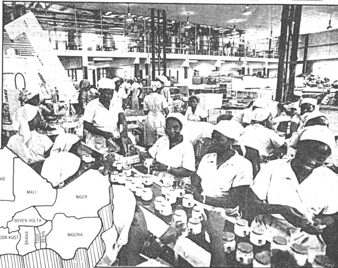
Verpakkingsafdeling van een fabriek in Lagos, Nigeria